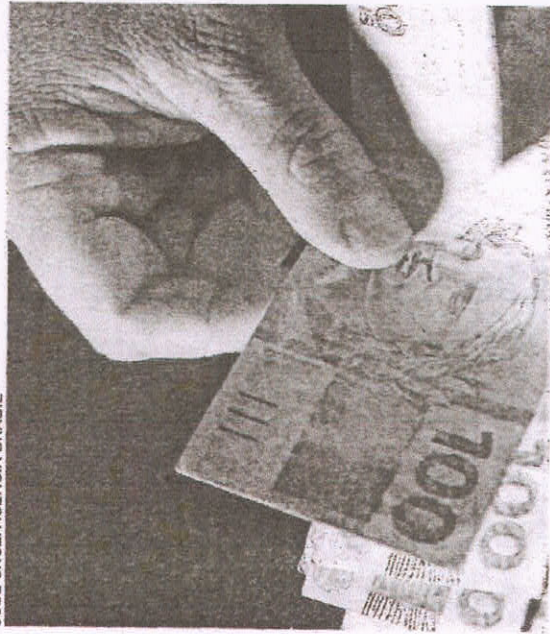
VALOR estabelecido por Bolsonaro deve ser pago em fevereiro