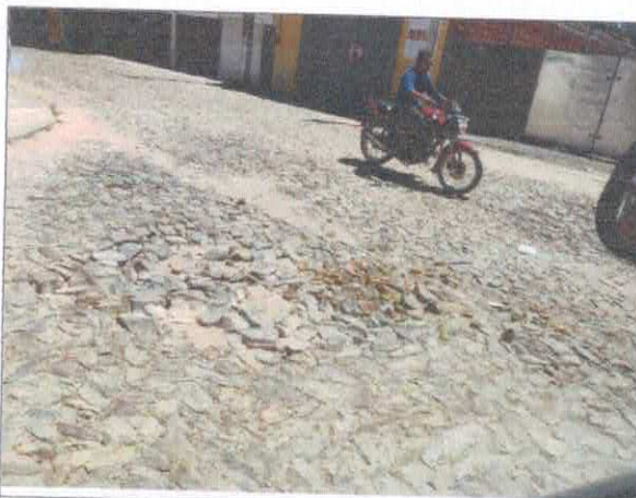
RUA JOSÉ ELIAS