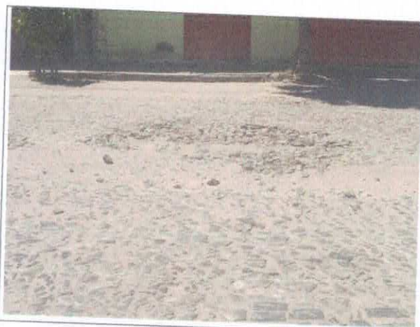
RUA MANOEL MARQUES