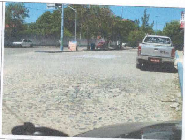
RUA MANOEL MARQUES