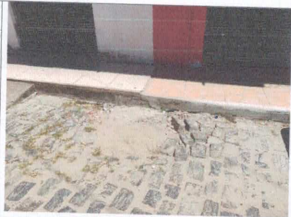
RUA AFONSO FONTES