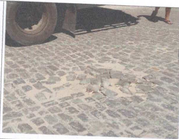
AV. MANOEL TEIXEIRA