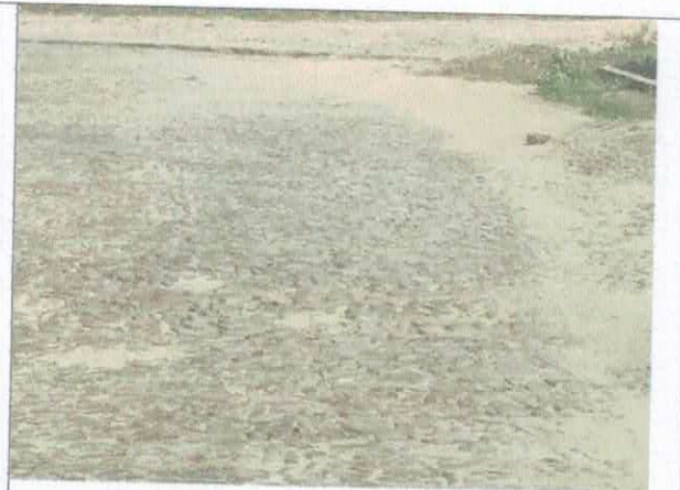
RUA 7 DE SETEMBRO