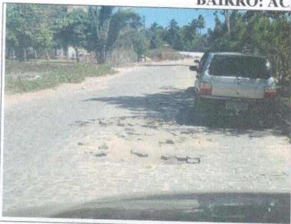
LOCALIDADE LAGOA GRANDE