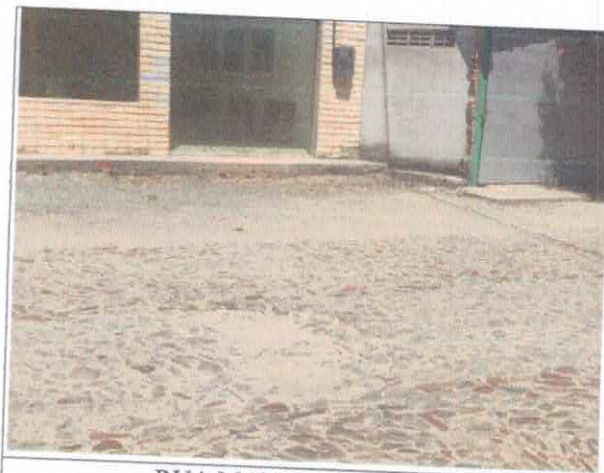
RUA MARÇAL DE SOUSA