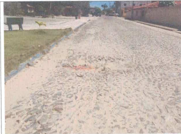
RUA MARÇAL DE SOUSA