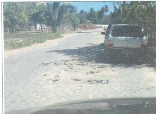
LOCALIDADE LAGOA GRANDE