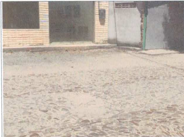
RUA MARÇAL DE SOUSA