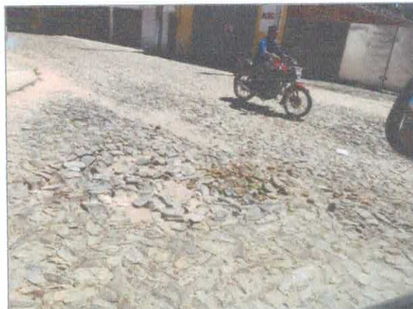
RUA JOSÉ ELIAS