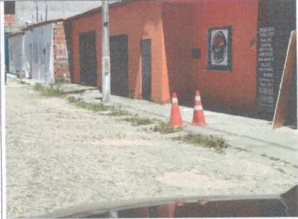
RUA AFONSO FONTES