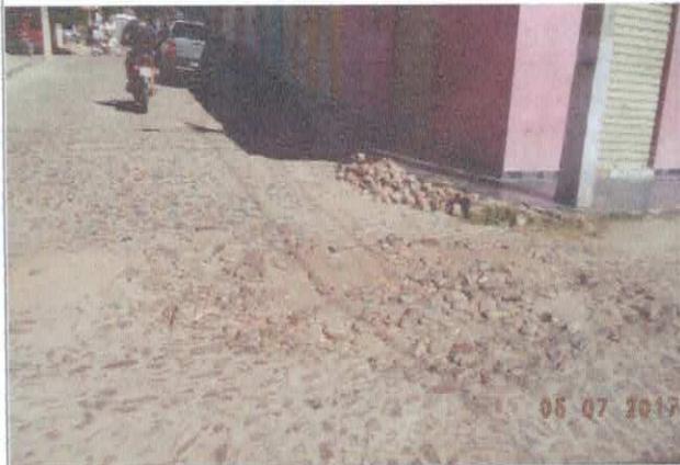
RUA AFONSO FONTES