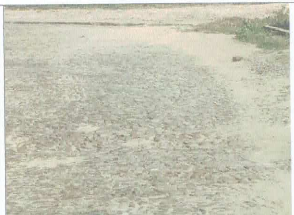
RUA 7 DE SETEMBRO

Rita Amélia RITA AMÉLIA MENDES BRANDÃO ROSA ENGENHEIRA CIVIL CREA/CE - 320505