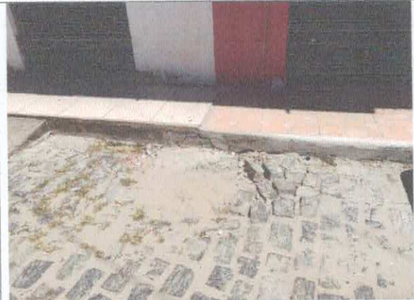
RUA AFONSO FONTES