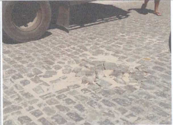
AV. MANOEL TEIXEIRA