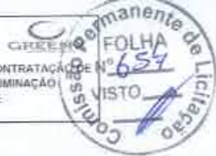
TABELA SEMEPA V03-1 (DESCRIBÇÃO)/PREFEITURA DE Jijoca de Jericoacoara

ORÇAMENTO TOMADA DE PREÇOS Nº 2017.03.08.01/TP/PREFEITURA MUNICIPAL JIJÓCA DE JERICOACOARA/CE cujo objeto é a CONTRATAÇÃO DE EMPRESA ESPECIALIZADA NA EXECUÇÃO DE OBRAS E SERVIÇOS DE ENGENHARIA CONCERNENTES À GESTÃO DA REDE DE ILUMINAÇÃO PÚBLICA DO MUNICÍPIO DE JIJÓCA, INCLUINDO OS SERVIÇOS DE TELEGESTÃO, OBRAS DE AMPLIAÇÃO, REFORMA, MELHORIA E EFICIENTIZAÇÃO, ABRANGENDO O FORNECIMENTO DE MÃO DE OBRA, MATERIAIS E EQUIPAMENTOS